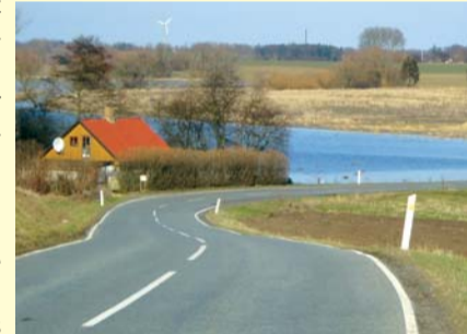
Mor Karens hus

Ved Hellested er der en bro, hvor der i tidligere tid var et vadested over Stevns å. Nær broen, på grænsen mellem de lavtliggende engarealer og den skrånende ådalsside, ligger et gammelt hus, der lokalt omtales som Mor Karens Hus, da det passer ind i Heibergs skuespil Elverhøj. På Hellested-siden fører en vej til rensningsanlægget, og derfra kan du følge en mærket sti mod nord, langs markskel, ad markveje og Tryggevælde åens bræmme. Mod syd fører en markvej langs engene. Disse små engparceller blev i 1919 udstykket fra præsteembedet og fordelt mellem alle landsbyens gårde og de nye husmandssteder. Opdelingen af engene er stort set den samme i dag og de fleste afgræsses. I pilekrattet holder mange fugle til bl.a. nattergalen. De engene, som bliver afgræsset, har et rigt blomsterliv. En mærket sti fører fra markvejen til Hellested Kirke. Markvejen munder ud i Præstemarksvej og der kan du dreje til højre ad Elverhøjvej. Snart når du til Elverhøj, som er en gravhøj fra bronzealderen. På toppen er der en pragtfuld udsigt over både ådalen og det flade Stevns.