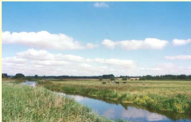
Tryggevælde åen ved skolestien

Skolestien går fra Køgevej over Tryggevælde å til Stevnsvejen. Det er den eneste sti, som er asfalteret. Derfor er den velegnet til en aftenur på cykel. Den byder på en flot udsigt over åen og ådalen. På begge sider af stien bliver engene afgræsset. Der er et rigt fugleliv i ådalen, såsom viber, ænder, gæs, fasaner og i forsommeren er der nattergale. Du kan fiske i åen, der er aborrer og gedder, men husk at købe fiskekort ellers er der ingen adgang til åen