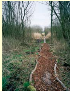
Sti til Fugletårnet

Vandreturen „Spor i Landskabet“ støder til Kirkestien og går ad gamle markveje langs engene og giver mulighed for en flot rundtur op over markerne. Fra dette spor fører en lille plankesti gennem pilekrattet til Roskilde Amts fugletårn. Heroppefra er der en flot udsigt over de brede engene. Da det er markveje, er der adgang fra kl. 6 til solnedgang. Spor i landskabet udgår fra P-pladsen ved Stolpehuse eller fra Engvej i St. Tårnby.