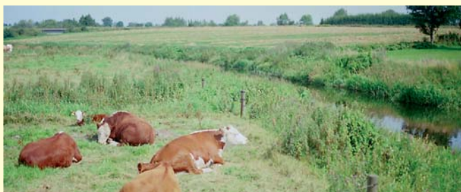
Tryggevælde åen ved Tingvejsbroen

Hvor landevejen fører over åen er der anlagt en god lille p-plads. Her er borde og bænke samt opsat en informationstavle over området. Fra P-pladsen kan du gå ned til kanten af åen og bl.a. studere vandløbsplanterne og smådyrene i åen. Du må ikke gå ned langs med åen, men du kan fra P-pladsen nyde de mange fugle på engen, især viberne i foråret og sommeren, og også de græssende kreaturer. Om vinteren holder mange ænder og svaner til på de oversvømmede engene.