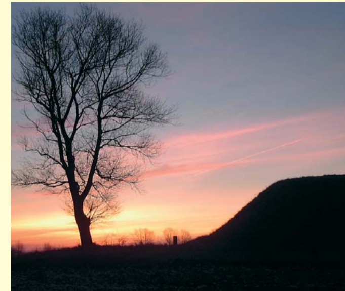
Maglehøjen ved forårsjævndøgn

En grusvej med en tydelig markering fører fra landevejen op til en plads, hvorfra en lille sti går langs hegnet op til jættestuen. Husk lommelygte.