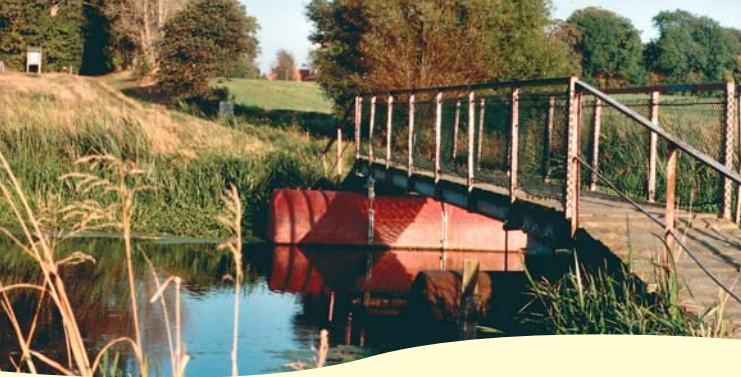
Pontonbroen ved Strøby (Nr. 6 Kirkestien)