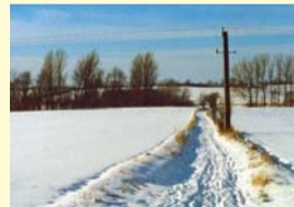
Engvejen til Lammehøj

Midt i Varpelev finder du skiltet, der viser ned til Lammehøj. Den gamle engvej byder på en flot tur ned til engene, hvor du finder Lammehøj. Den er en gammel gravhøj fra bronzealderen, hvor der er fundet både skeletter og genstande af guld. Som mange andre gravhøje blev denne også senere anvendt som rettersted. Den sidste henrettelse fandt sted i 1853. Fra Lammehøj kan du gå en tur videre ned i engene ved åen.