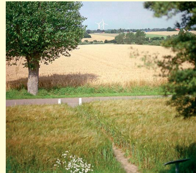
Udsigt fra Elverhøjen